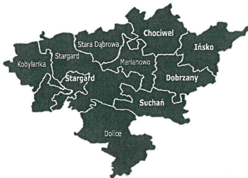
rys. Powiat Stargardzki

Dokument ten jest wynikiem doświadczeń ze współpracy z organizacjami pozarządowymi z lat poprzednich. Powstał on w oparciu o wiedzę, praktykę, doświadczenie i zaangażowanie jego realizatorów.