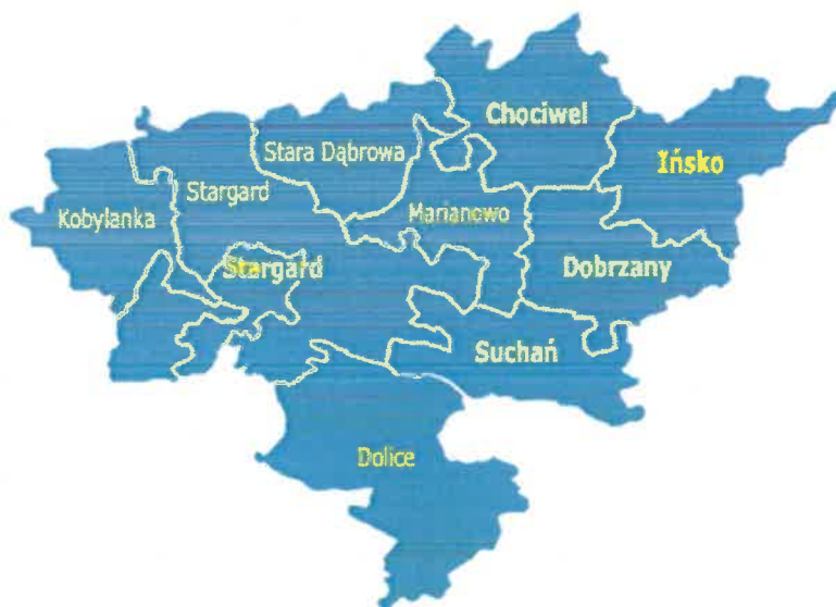
rys. Powiat Stargardzki

Powyższy Program stanowi dokument określający w perspektywie rocznej cele, zasady, przedmiot i formy współpracy, a także obszary oraz priorytetowe zadania publiczne realizowane w ramach współpracy Powiatu z organizacjami pozarządowymi na rzecz jego mieszkańców. Dokument ten tworzony każdego roku jest wynikiem doświadczeń z dotychczasowej wieloletniej współpracy z organizacjami pozarządowymi z lat poprzednich. Powstał on w oparciu o wiedzę, praktykę, doświadczenie i zaangażowanie jego realizatorów.